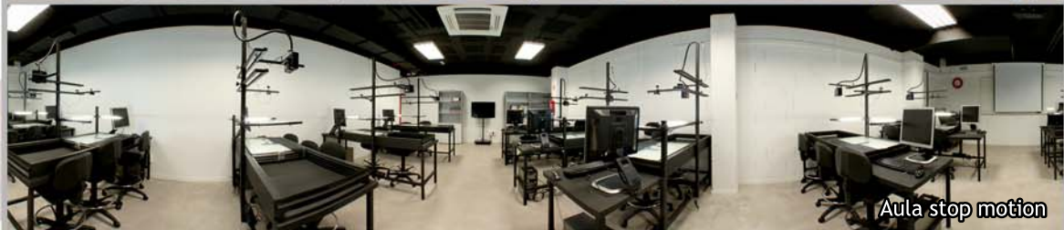
Aula stop motion