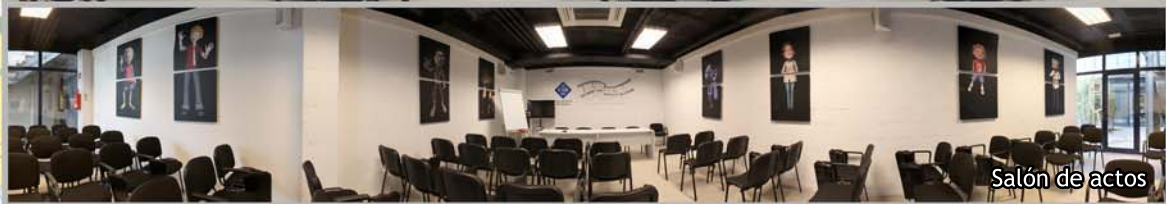
Salón de actos