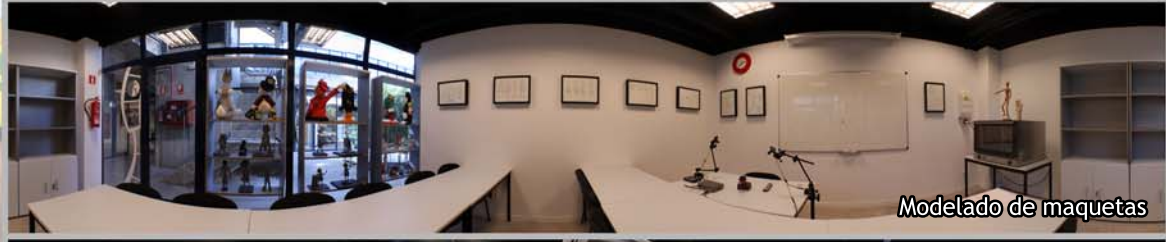
Modelado de maquetas